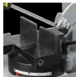
Schnellspanneinrichtung für Gehrungsschnitt mit gut ablesbarer Gehrungsskala